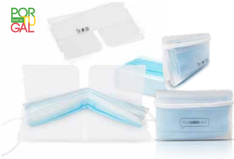
Keepsafe IP370598 Guarda-máscaras em PP 300 microns. Venda em múltiplos 100 unidades.