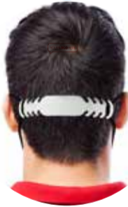
Holderpro Salva orelhas em PE.