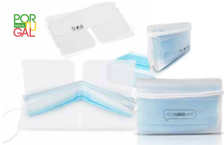
Keepsafe customized MV700096 Guarda-máscaras personalizado.