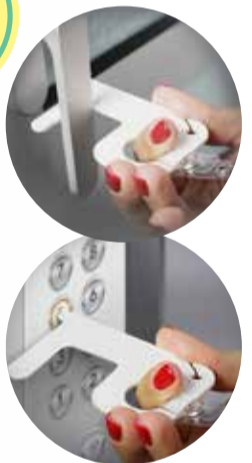
Keytouch Porta-chaves em PS, funções "no touch".