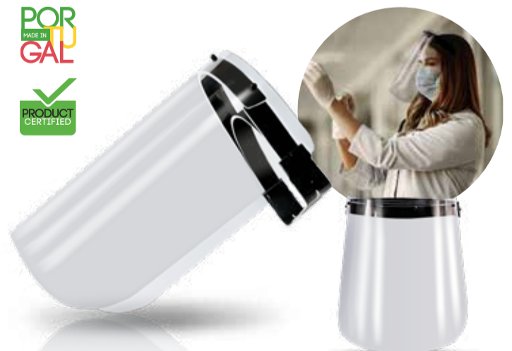
Shieldom IP370581 Viseira em policarbonato resistente e lavável. Com fácil adaptação ao tamanho da cabeça.